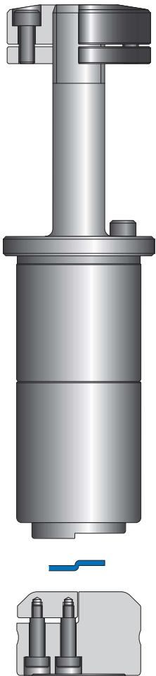
ฟอร์มมิ่ง ลง