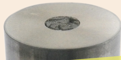
ウレタンキッカーが消耗した例