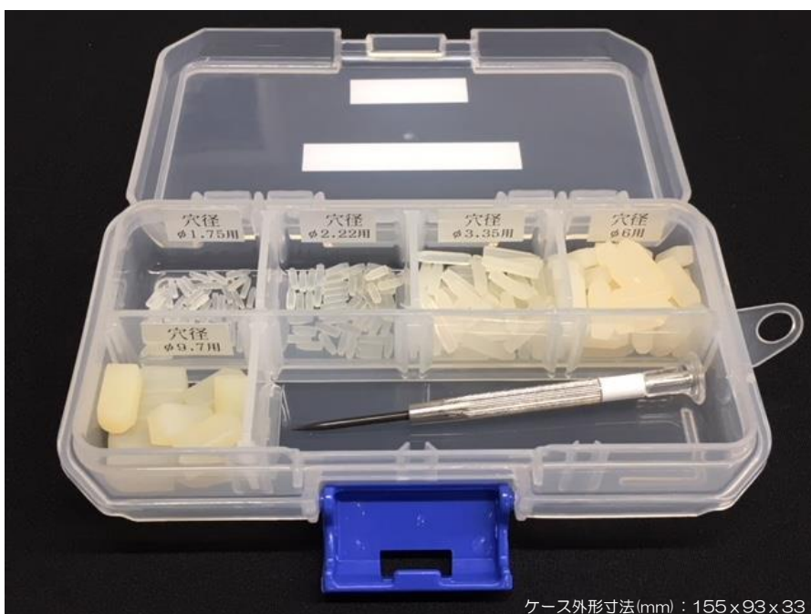
ケース外形寸法(mm) : 155×93×33