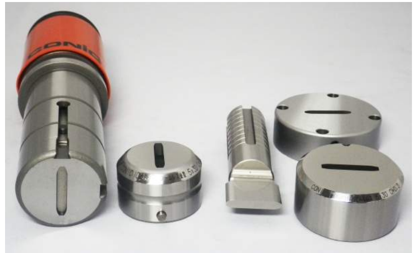
アマダロングタイプ例