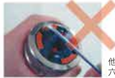
他社金型 六角レンチで調整必要

わずか数秒で規定のパンチハイトに調整できます。 しかも金型メンテナンスの部品着脱時に六角レンチ等 の工具は一切不要です。弊社標準金型比1/4の時間で、 どなたでも安全・正確・スピーディーなメンテを可能にしました。