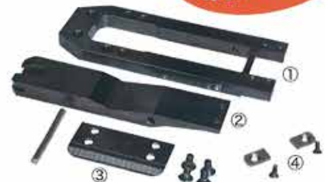
*AAA(3A)品*も状態によっては再生・修理が可能です。