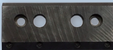
製造事業者：東栄工業株式会社様