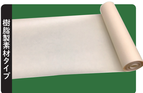
樹脂製素材タイプ